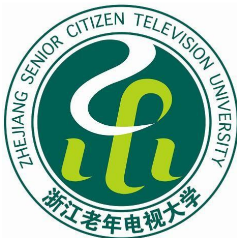
图A.1 浙江老年电视大学标志